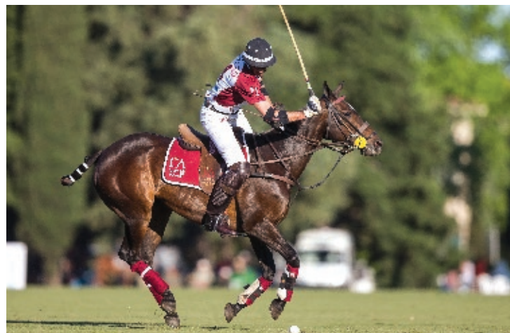
A. Imperial / Galponera (R. Slaney y Capota)