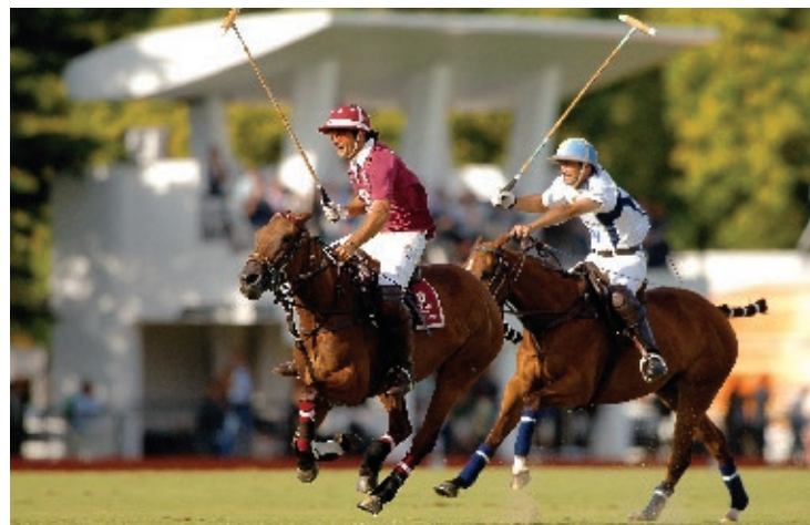
A. Geisha (R. Slaney y Primavera)