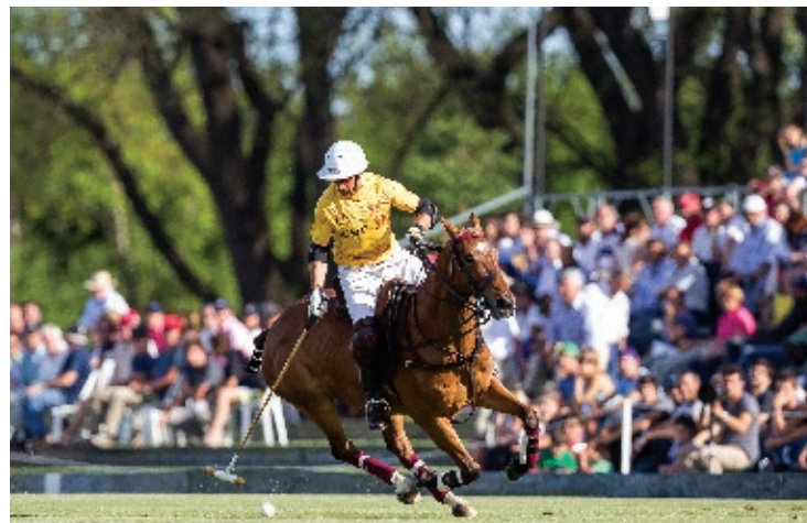
@Digital (R. Slaney y Dinamita)