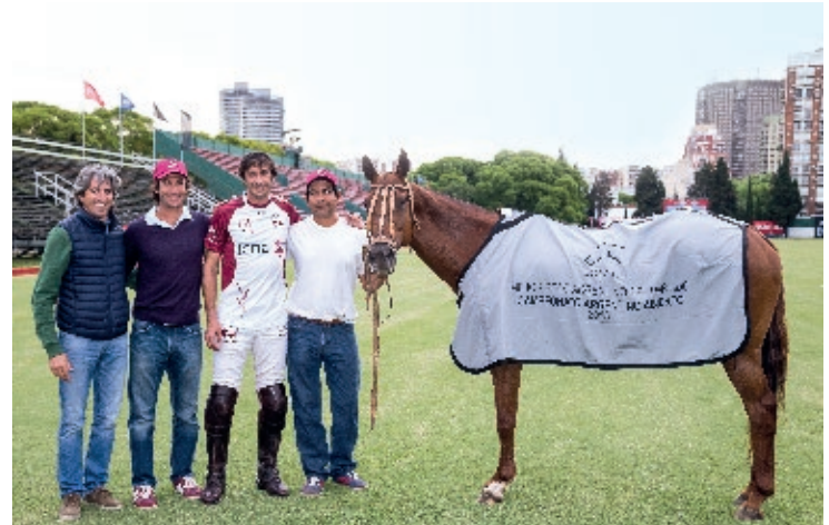
A. Dinámica (R. Slaney y Dinastía)