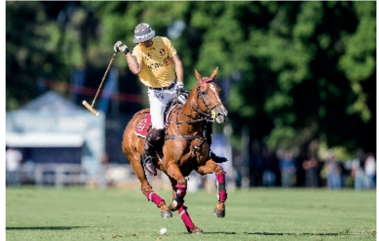
Mística (spc USA)