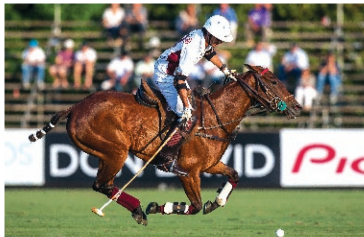
A. Anónima (R. Slaney y Giusti)