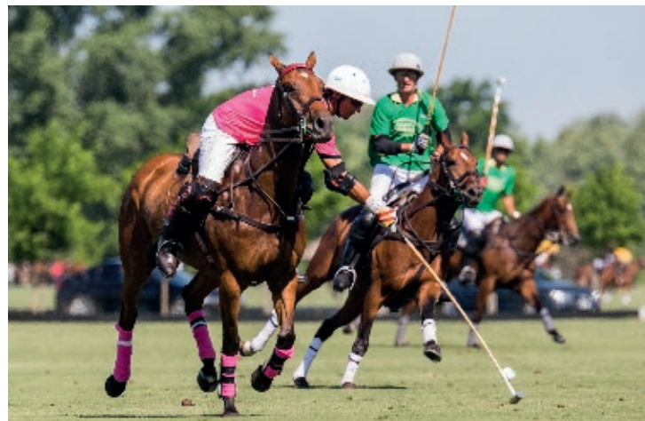
@One (R. Gringo y Manzanita)