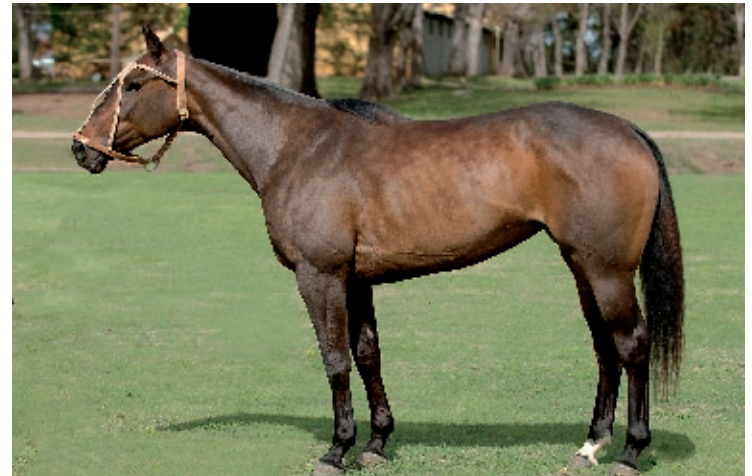
GETE Moon (P. Virtual y La Luna)