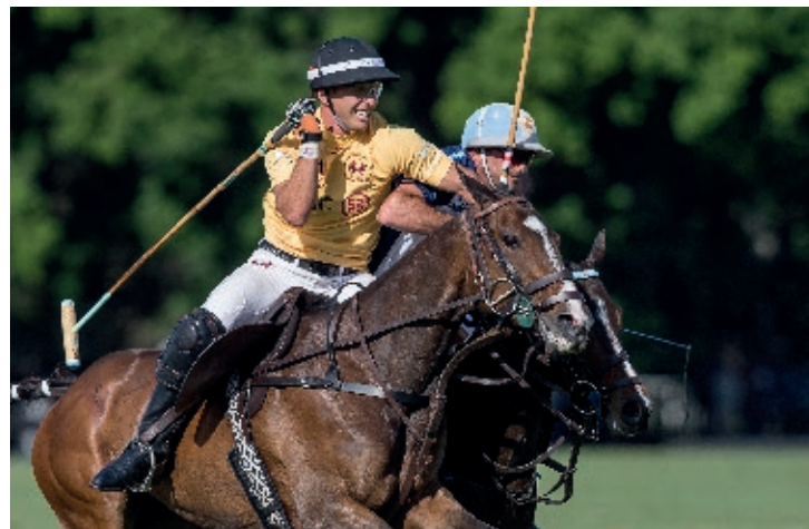
Dejavú (spc USA)