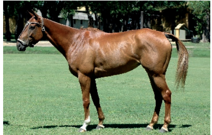
Diva (Ecliptical y Sage)