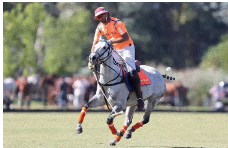
Rayo Carbonada (O. Trueno y Leña Seca)