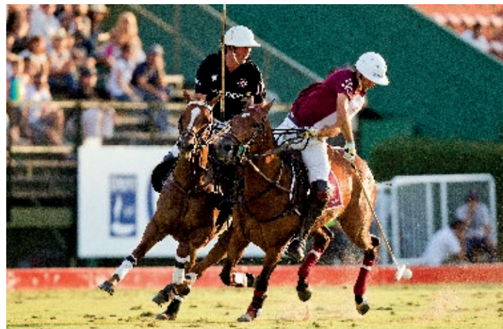
Cereza (R. Slaney y Cereza Vieja)