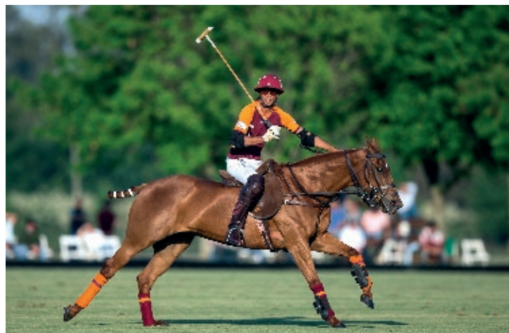
Griega (GETE Zorrino)