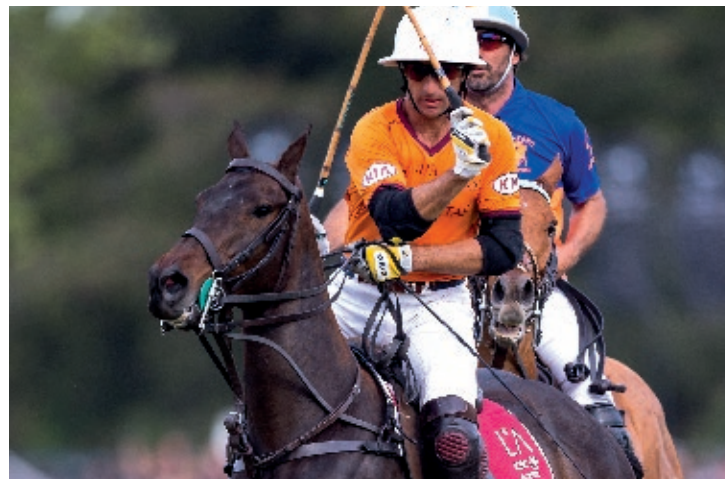
R. Amiga ( Bagual y A. Anónima)