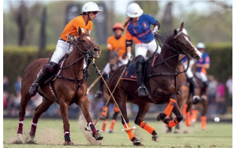
Iaia Distraída (R. Slaney y Dinastía)