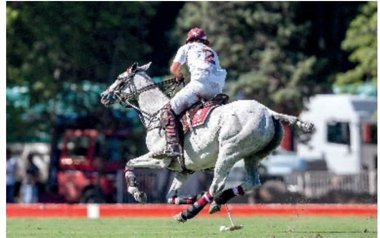
Aluz (Vigorous Toss y G. Richier)