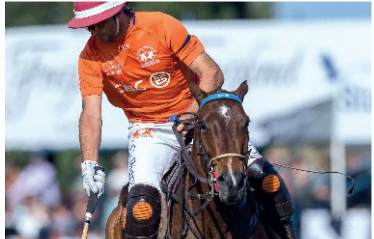
L. Explosiva (R. Slaney y Dinamita)