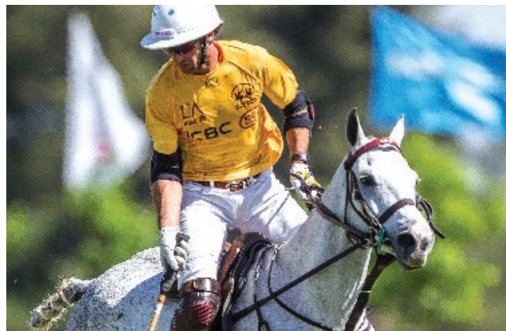
Automática (F. Automatic y First to Shine)